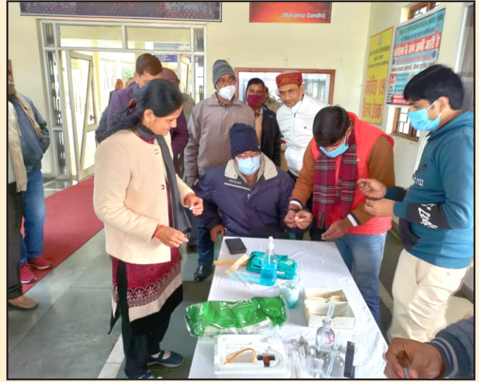
2 अगस्त 2021

विश्वविद्यालय के अर्न्तगत परिसर चिकित्सालय द्वारा समय-समय पर निःशुल्क रक्त जाँच शिविर आयोजित किये जा रहे हैं जिसके माध्यम से छात्र-छात्राओं, कर्मचारियों तथा प्रक्षेत्र एवं निर्माण कार्य करने वाली 500 से अधिक महिलाओं की निःशुल्क हीमोग्लोबिन एवं रक्त समूह आदि की जांच की जा चुकी है तथा ऐनिमिक महिलाओं को आयरन की गोलियां वितरित की जा रही हैं।