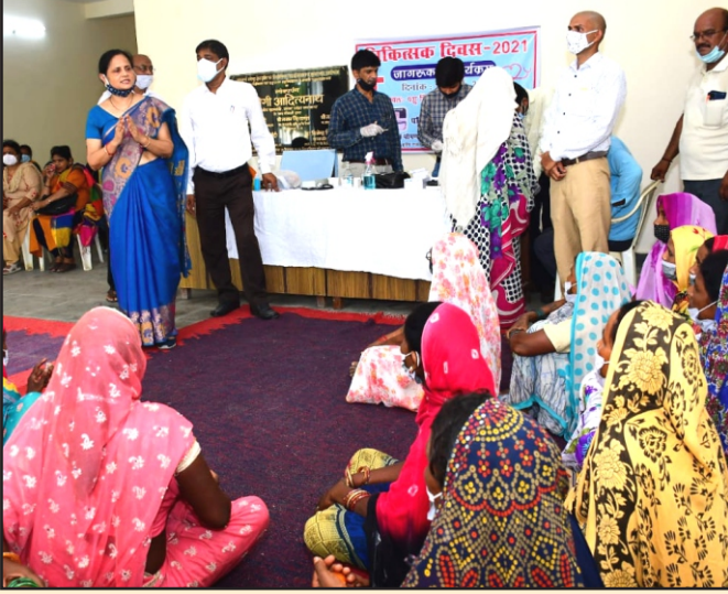
1 जुलाई 2021