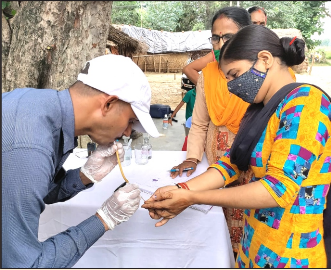
1 फरवरी 2021