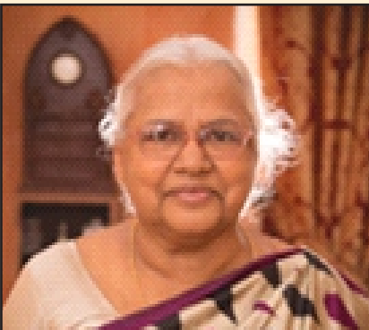
पदमश्री डा. सोसम्या आइपे