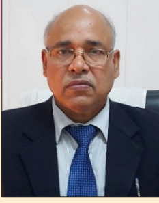
कुलपति के कलम से

आचार्य नरेन्द्र देव कृषि एवं प्रौद्योगिक विश्वविद्यालय, कुमारगंज, अयोध्या महिला सशक्तीकरण हेतु निरन्तर प्रयासशील रहा है जिससे माननीय कुलाधिपति एवं राज्यपाल, उत्तर प्रदेश, श्रीमती आनन्दीवेन पटेल की परिकल्पना को साकार किया जा सके। इसी कड़ी में विश्वविद्यालय द्वारा सामुदायिक विज्ञान महाविद्यालय के अन्तर्गत महिला अध्ययन केन्द्र की स्थापना जून, 2021 में की गयी। महिला अध्ययन केन्द्र के माध्यम से विश्वविद्यालय के कार्य क्षेत्र में आने वाली ग्रामीण महिलायें व बालिकाओं को व्यवहारिक रूप से उनकी शिक्षा, स्वास्थ्य, स्वाभिमान, आर्थिक स्वावलम्बन व महिलाओं के विरुद्ध सामाजिक कुरीतियों से उन्मूलन आदि के प्रति जागृत किया जा रहा है। महिलाओं के सम्मुख ऐसी महिलायें जो प्रेरणा श्रोत हैं, को चिन्हांकित कर उनसे परस्पर संवाद स्थापित कराया जा रहा है। महिलाओं के स्वास्थ्य हेतु विश्वविद्यालय द्वारा ग्रामीण क्षेत्रों में चिकित्सा शिविर का आयोजन कर उनको पोषण व स्वास्थ्य सम्बन्धी जानकारी प्रदान की जा रही है। इसके अतिरिक्त महिलाओं के सशक्तीकरण तथा बच्चों के सर्वांगीण विकास हेतु महाविद्यालय द्वारा समय-समय पर प्रशिक्षण, प्रतियोगिता एवं अन्य कार्यक्रमों का आयोजन किया जा रहा है जिसमें ग्रामीण महिलाओं व बच्चों की भागीदारी उत्साहवर्धक है। महाविद्यालय द्वारा समय-समय पर किशोरियों के उत्थान हेतु प्रभावी कार्यक्रम आयोजित किये जा रहे हैं, जिसके फलस्वरूप ग्रामीण महिलायें एवं बालिकायें लाभान्वित हो रही है।