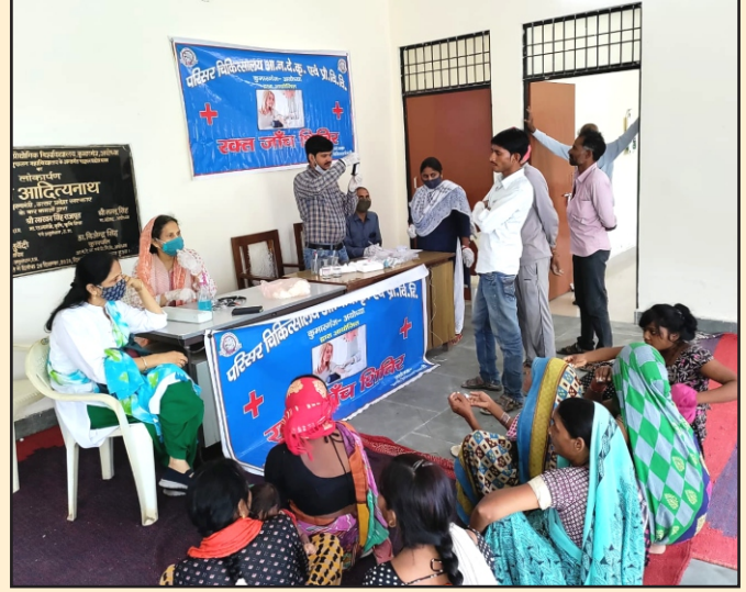
11 जुलाई 2021