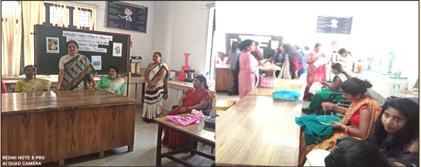
(लाभार्थी 35 महिलायें व किशोरिया)